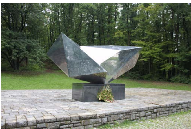
Dotrščina-Park Vojina Bakič Kristall © A. Walther

Während der faschistischen Ustaša-Herrschaft in Kroatien (1941-45) wurden in und um Zagreb circa 18.000 Regimegegner ermordet. Schätzungsweise 7000 von ihnen wurden auf dem Gelände des heute grössten Parks von Zagreb hingerichtet: Dotrščina. Ein auffallend frisches Holzschild bestätigt, dass wir am gesuchten Ort angekommen sind. Leicht ansteigend führt uns der Weg zu einem gepflasterten Platz am Waldrand. Dort steht auf einem Steinsockel ein überdimensionaler Kristall aus rostfreiem Stahl. Ein Grabgesteck und ein Gedenkstein deuten darauf hin, dass es sich hier nicht nur um abstrakte Kunst handelt. Auch