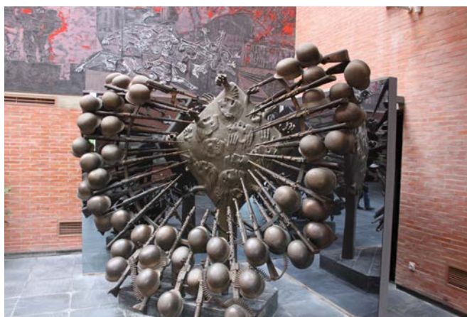
Kragujevac Museum des 21. Oktober

In dem Museum sieht man zuerst eine Ausstellung abstrakter Gemälde des Künstlers Peter Lubarda. Mit hoher Intensität und Ausdruckskraft setzen sich seine Bilder aus den 1960er Jahren mit Gewalt, Tod und der darüber empfundenen Ohnmacht auseinander.