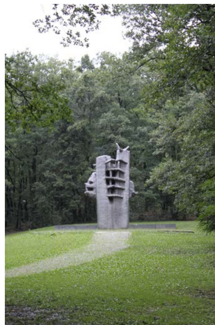
Dotrščina-Park Zagreb

Zitationshinweis: Haberkorn, Tobias/ Pörtig, Saskia/ Schütrumpf, Paul/ Schuch, Daniel/ Warneck, Dorothea: (Post-)jugoslawische Geschichtskultur: Ein Blick durch das Schlüsselloch, in: Lehrstuhl für Osteuropäische Geschichte (30.3.2014), URL: http://www2.uni-jena.de/philosophie/histinst/osteuropa/