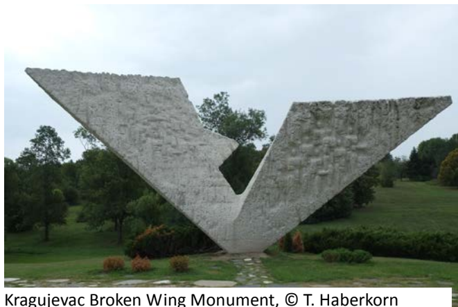
Kragujevac Broken Wing Monument

In dem Gedenkpark der ab 1959 angelegt wurde, markieren elf Denkmäler die Orte der Massengräber. Das bekannteste ist das Denkmal „Der gebrochene Flügel“. In den Flügeln der weißen v-förmigen Beton-Skulptur sind Reliefs von Menschen zu erkennen. Das Denkmal ist