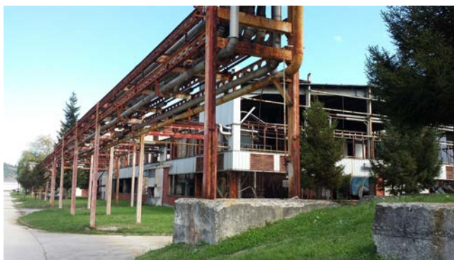
Potočari, Farbhallen, © A. Walther

stationiert waren, lässt sich ein weiterer Versuch eine identitätsstiftende Funktion des Massenmordes für die bosniakische Nation zu finden, beobachten. Mit Unterstützung des Londoner Imperial War Museums wurde der kleine Gedenkraum im Jahr 2007 eröffnet. Hier soll ein Ort der Trauer und Erinnerung sein, enthalten sind jedoch auch anklagende Elemente gegen „den Westen“ und die serbischen Täter. Die bewusst hergestellte Analogie des Massakers zu Auschwitz („The most horrific of Crimes – Genocide – that happened since the Holocaust in Europe“) wird bereits im Eingangsbereich gesetzt und macht jede weitere kritische Reflexion der historischen Ereignisse und des heutigen Umgangs mit dem historischen Ort unmöglich. Über die Geschichte des Ortes selbst, den „Tatort“, erfährt der Besucher kaum etwas. Beim Gang durch die verfallenden Fabrikhallen auf dem Gelände, in denen 1995 tausende Flüchtlinge Schutz suchten und schließlich von serbischen Soldaten selektiert und die Männer zu ihren Hinrichtungsstätten im