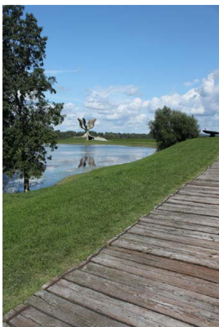
Jasenovac Steinerne Blume, © A. Walther

Jasenovac sollte in Jugoslawien ein Ort der Erinnerung sein. Auch heute ist hier ein Ort der Erinnerungen. Im sozialistischen Jugoslawien war Jasenovac auch ein Ort der Zukunft. Während des Zweiten Weltkriegs hatte hier die kroatische Ustaša Serben, Juden, Roma und Regimegegner in einem Konzentrationslager zusammengepfercht, ausgehungert, gefoltert und ermordet. Der Ort eines Verbrechens von Jugoslawen (Kroaten) an Jugoslawen war im Vielvölkerstaat schwer zu erinnern, da hier die Grundlage des Staates, die Ideologie der Bruderschaft und Einigkeit zwischen den verschiedenen Ethnien, in Frage gestellt wurde. Wer