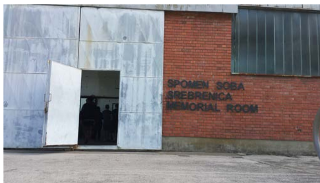
Srebrenica Memorial Room

Geschichte noch ist – sie gehört noch lange nicht der Vergangenheit an. Im „Memorial Room“, der sich auf der gegenüberliegenden Straßenseite in einer der alten Lagerhallen befindet, in der 1995 die niederländischen Blauhelmsoldaten