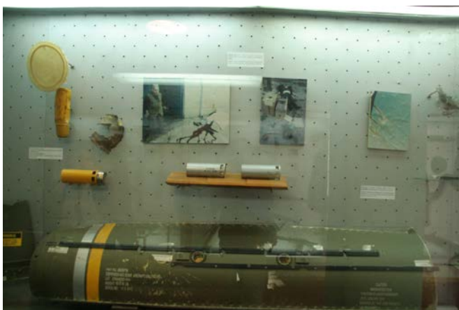
Militärhistorisches Museum Belgrad, © A. Walther

Durch einen Gang geht es nun ins Erdgeschoss. Hier beginnt der neue, post-jugoslawische Teil der Ausstellung. Nicht mehr Jugoslawien wird präsentiert, sondern Serbien. Serbien wird als „gutes UNO-Mitglied“ das sich an Blauhelmissionen beteiligte und dafür Orden empfangen präsentiert. Kein Wort darüber, dass eine gelähmte UNO