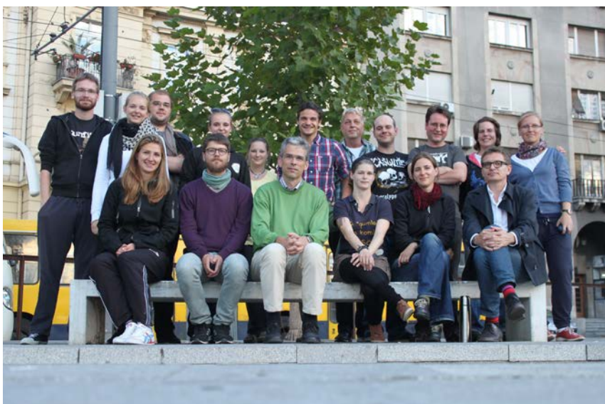
Exkursion Geschichtskultur und zeithistorische Museen im ehemaligen Jugoslawien, September 2013

angrenzenden Räume. Wir können kaum sagen, ob dort nicht auch differenzierter erinnert wird oder andere Narrative gepflegt werden. Ebenso bleibt fraglich, ob die Orte, die wir gesehen haben pars pro toto für den Geist der Herrschenden oder auch für den Geist der Bevölkerungen stehen und ob unser normativer Erinnerungsbegriff und unsere wissenschaftlichen Konzepte den Gegebenheiten vor Ort immer gerecht werden, bleibt kritisch zu hinterfragen. Dieser Exkursionsbericht kann für uns daher nur Stückwerk auf dem Weg der Erschließung und Auseinandersetzung mit der Geschichtskultur im postjugoslawischen Raum bleiben.