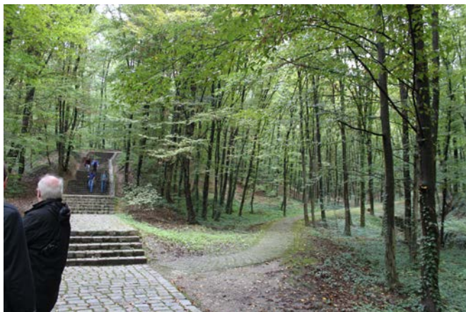
Dotrščina-Park Zagreb

zusätzliche künstlerische Elemente erweitert werden sollen. Ebenfalls geplant war die Errichtung eines Museums. Dazu ist es jedoch nie gekommen.