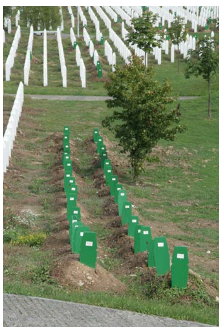
Srebrenica Memorial

Kann auf dem Trümmerhaufen eines Massenmordes eine gemeinsame Zukunft errichtet werden? Das heutige Bosnien ist ein besonders prägnantes Beispiel für den Versuch einer Antwort auf diese Frage. Der von zahllosen Kriegsverbrechen und sogenannten ethnischen Säuberungen geprägte Sezessionskrieg, der 1992 begann, fand am 11. Juli 1995 seinen grausamen Höhepunkt im Massaker von Srebrenica. Auf Befehl von Ratko Mladić wurden etwa 8000 Männer und Jungen ermordet. Im Gedenken an das Verbrechen, das der Internationale Strafgerichtshof für das ehemalige Jugoslawien (ICTY) als Genozid einstufte, wurde im Jahr 2003 ein Friedhof in Potočari eingeweiht, dem Ort wo viele Menschen