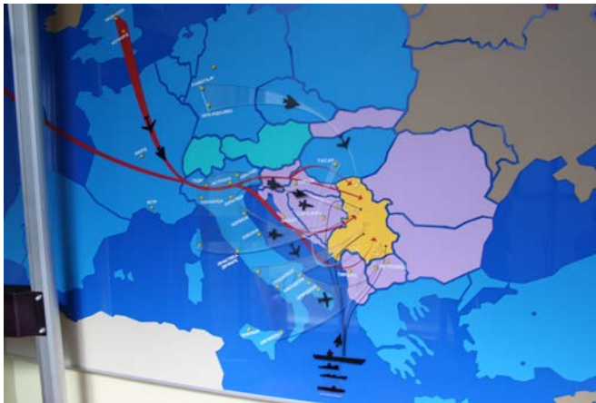
Militärhistorisches Museum Belgrad

die Serben in den Neunziger Jahren nicht vom Morden in Bosnien und im Kosovo abhalten konnte, kein Wort darüber, dass die Blauhelme die in Sarajevo ausharrenden Menschen mit dem Nötigsten versorgen mussten. Im nächsten Raum geht die Erzählung direkt zum Krieg gegen die Nato des Jahres 1999 über. Hier werden Bombenreste, Fliegeruniformen, Wrackteile etc. der Gegner präsentiert. Uns soll verdeutlicht werden, dass das angesehene UNO-Mitglied zum Opfer der Nato wurde. Die Ausstellung endet mit zwei Tafeln. Auf der ersten werden Größe und Ausstattung der Serbischen Armee und ihrer Gegner verglichen –